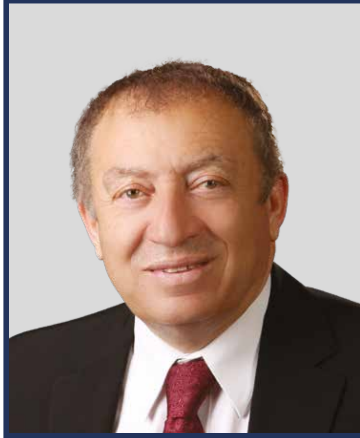
معالي أ. خالد العسيلي وزير الإقتصاد الوطني الفلسطيني