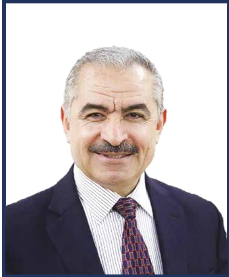
دولة د. محمد اشتية رئيس الوزراء الفلسطيني