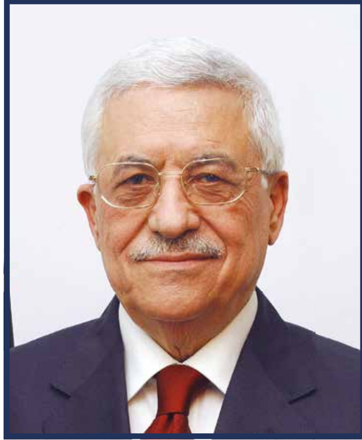
فخامة الرئيس محمود عباس "أبو مازن" رئيس دولة فلسطين