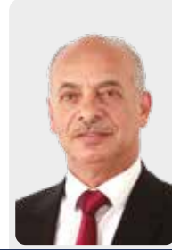
مشهور سعيد ابو خلف نائب الرئيس